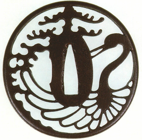
201 鶴松透鐔 無銘 赤坂 丸形・角耳小肉・鉄地 江戸時代 厚さ6.2×縦75.0×横74.0mm