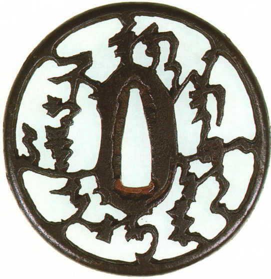
200 文字地透鐔 無銘 赤坂 丸形・丸耳・鉄地 厚さ7.4×縦78.5×横77.0mm