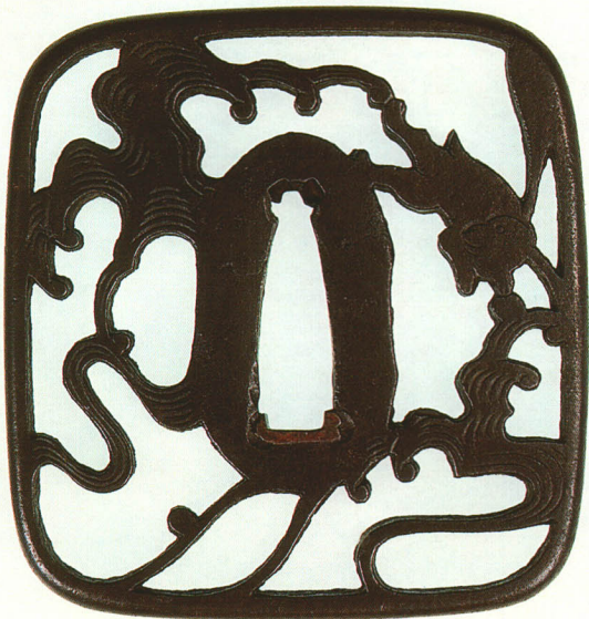
202 浪に兎透鐔 無銘 赤坂 撫角形・角耳小肉・鉄地 江戸時代 厚さ5.7×縦71.3×横68.0mm