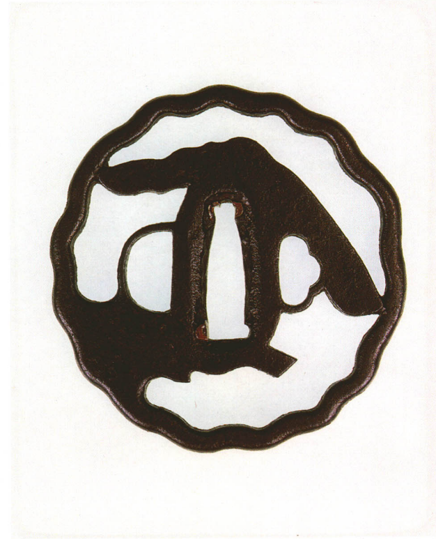
211 松透鐺 無銘 林 多木瓜形・角耳小肉・鉄地 江戸時代初期 厚さ6.4×縦77.4×横75.0mm