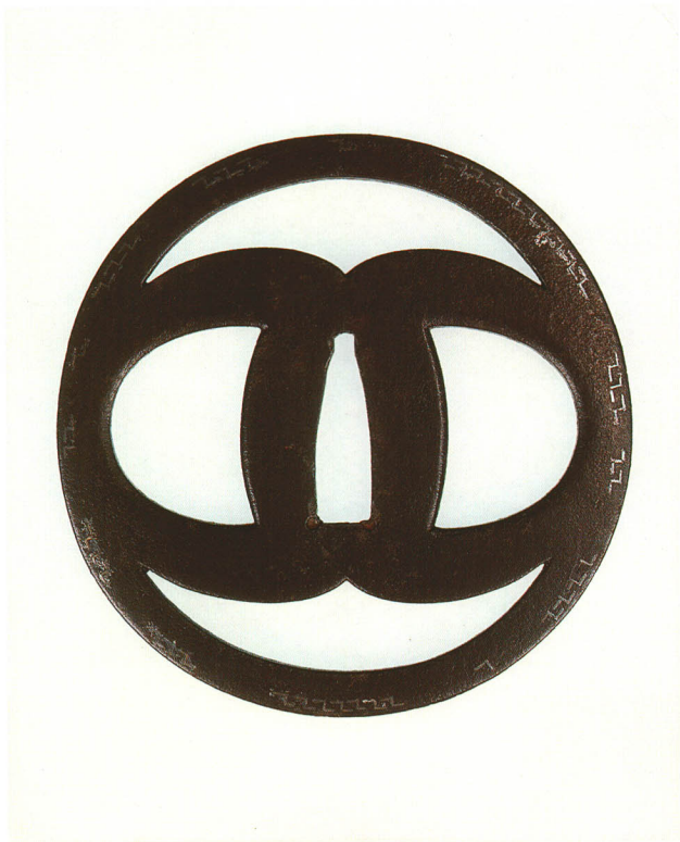
208 輪違透鐺 無銘 肥後 丸形・角耳・鉄地・生透し 厚さ3.3×縦82.7×横81.6mm