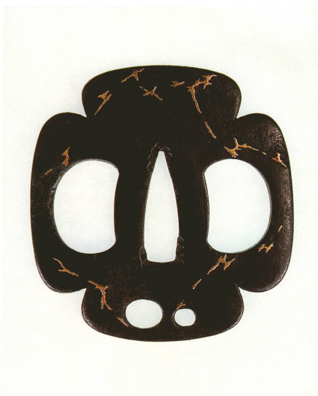
215 枯木図鐔 無銘 林 隅切木瓜形・角耳・鉄地・枯木金象嵌 江戸時代中期 厚さ4.0×縦80.4×横76.6mm