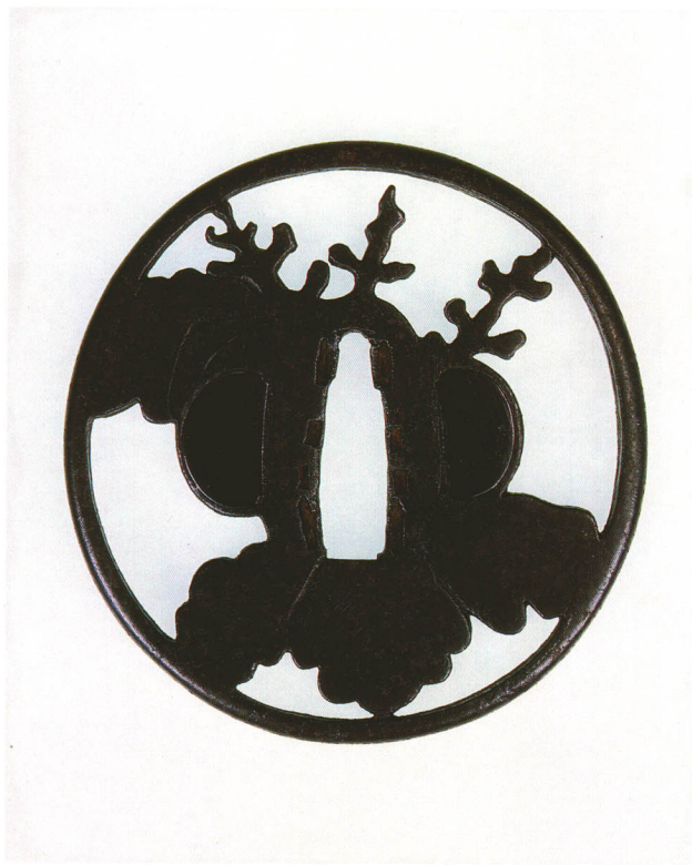
212 桐透鐔 無銘 林藤平 丸形・丸耳・鉄地 江戸時代中期 厚さ4.6×縦80.6×横78.0mm