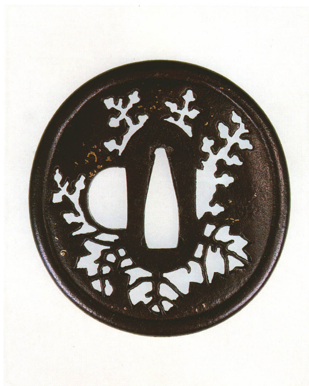
213 桐透鐔 無銘 林藤八 丸形・丸耳・鉄地 江戸時代中期 厚さ5.3×縦80.0×横76.0mm