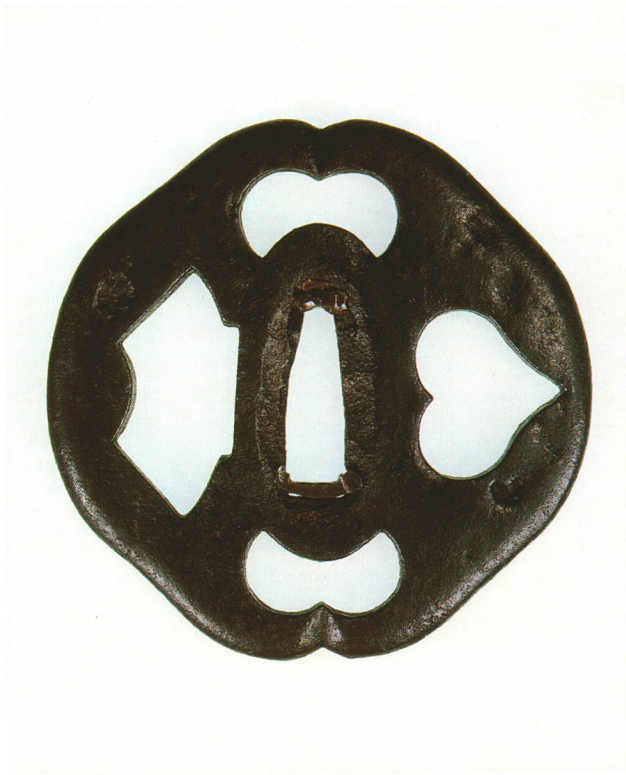
216 四方透鐺 無銘 林 崩し木瓜形・丸耳・鉄地 厚さ5.2×縦74.5×横75.9mm