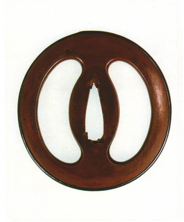
219 海鼠透鐺 無銘 神吉 長丸形・赤銅覆輪・素銅地 江戸時代中期 厚さ5.0×縦80.0×横76.7mm