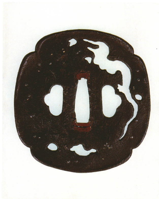
220 雲龍透鐔 銘 甲府住 信家 木瓜形・打返耳・鉄地 室町時代後期 厚さ3.8×縦94.6×横91.6mm