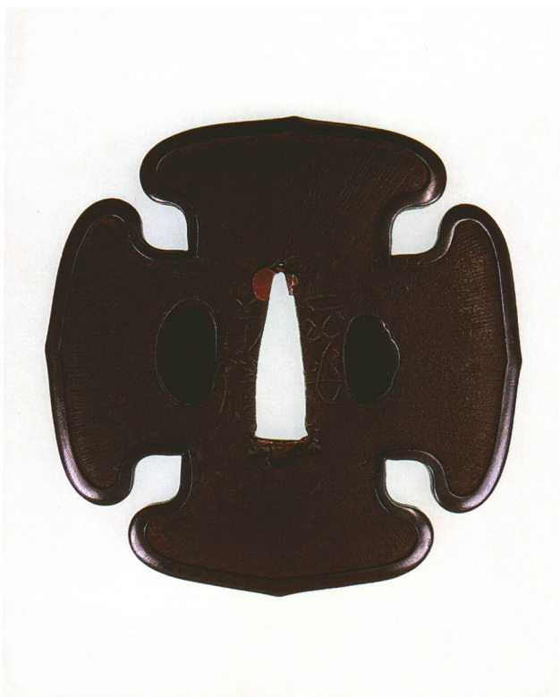
222 阿弥陀鑪鐔 銘 法安兼信 猪目木瓜形・赤銅覆輪耳・鉄地 江戸時代中期 厚さ4.2×縦80.0×横79.0mm