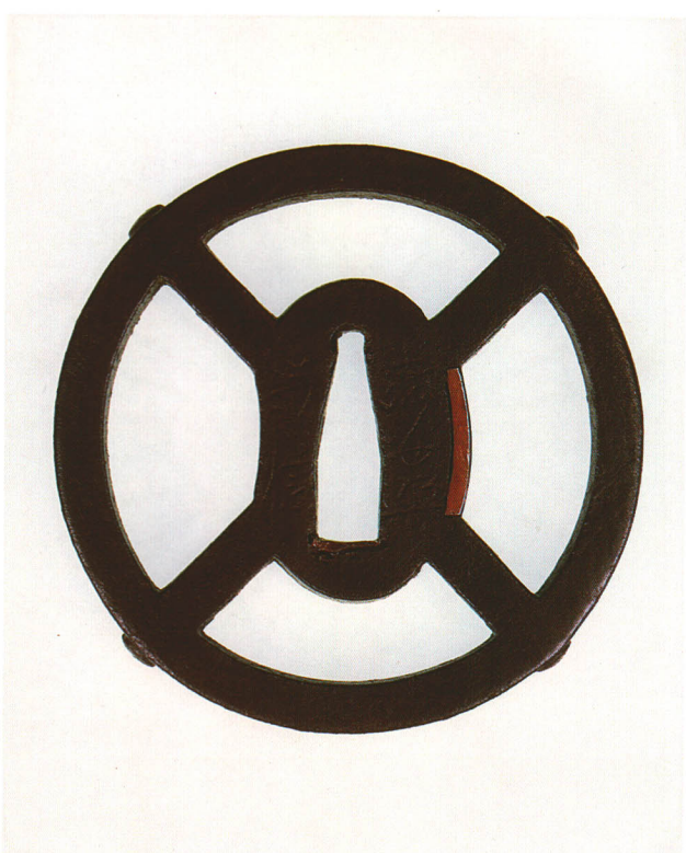
223 違棒透鐔 銘 法安兼信(花押) 丸形・角耳・鉄地 江戸時代中期 厚さ7.0×縦77.0×横76.5mm