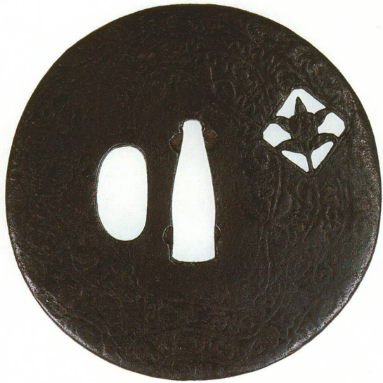
224 橘透鐺 無銘 法安 丸形・丸耳・鉄地 厚さ3.9×縦83.0×横82.5mm