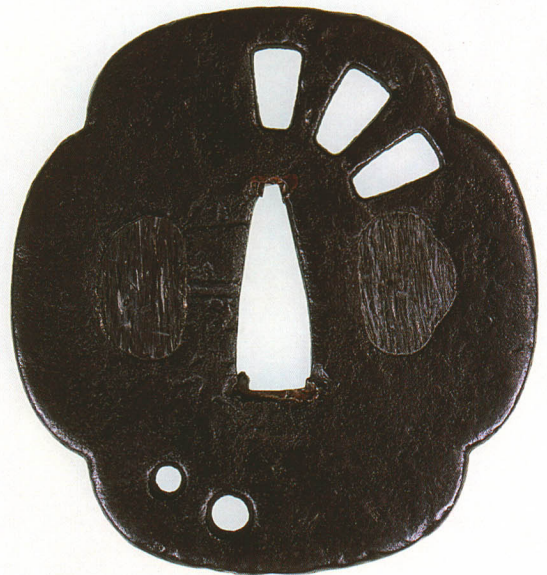
227 腕抜穴二つ透鐺 銘 山吉兵 木瓜形・角耳小肉・鉄地・室鉛埋 江戸時代初期 厚さ3.4×縦76.0×横70.4mm