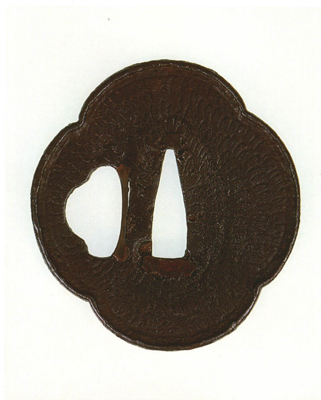
229 変形魚子打鐺 無銘 山吉 木瓜小形・打返耳・鉄地 厚さ3.0×縦62.0×横57.0mm