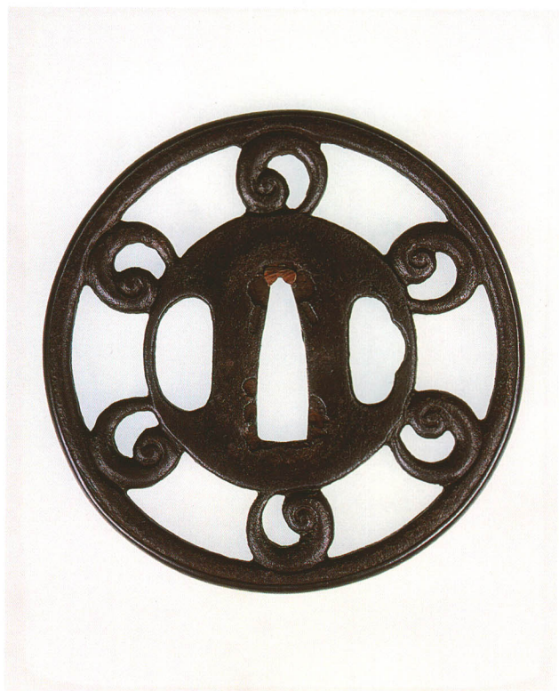
230 巴地透鐺 無銘 山吉 丸形・丸耳赤銅覆輪・鉄地 厚さ4.0×縦81.0×横80.4mm