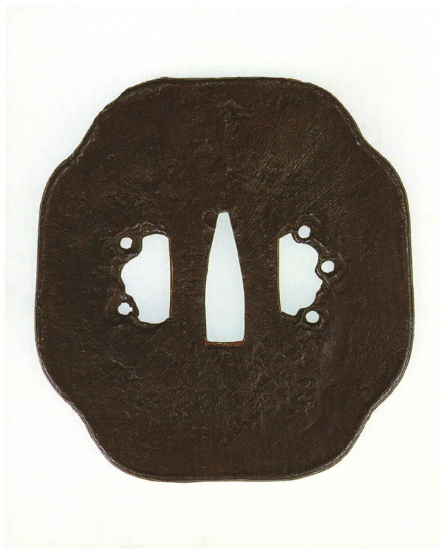
228 阿弥陀鑪鐺 銘 山吉 長木瓜形・打返耳・鉄地 江戸時代初期 厚さ3.4×縦85.0×横79.0mm