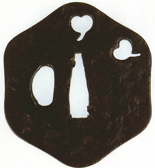
243 猪目透鐺 無銘 明珍 六角形・角耳・鉄地 厚さ5.2×縦78.7×横69.0mm