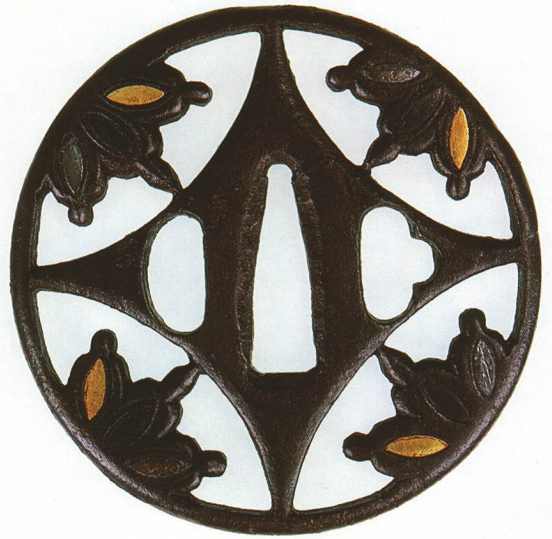
241 菱・糸巻透鐺 無銘 明珍 丸形・丸耳・鉄地 厚さ4.9×縦76.0×横76.0mm