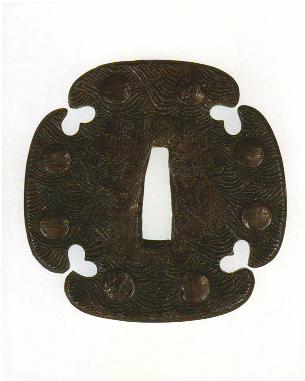
260 ニツ引両据紋波図鐺 無銘 葵 割込木瓜形・角耳(面を取る)山銅地 鎌倉時代後期 厚さ6.5×縦78.6×横78.4mm