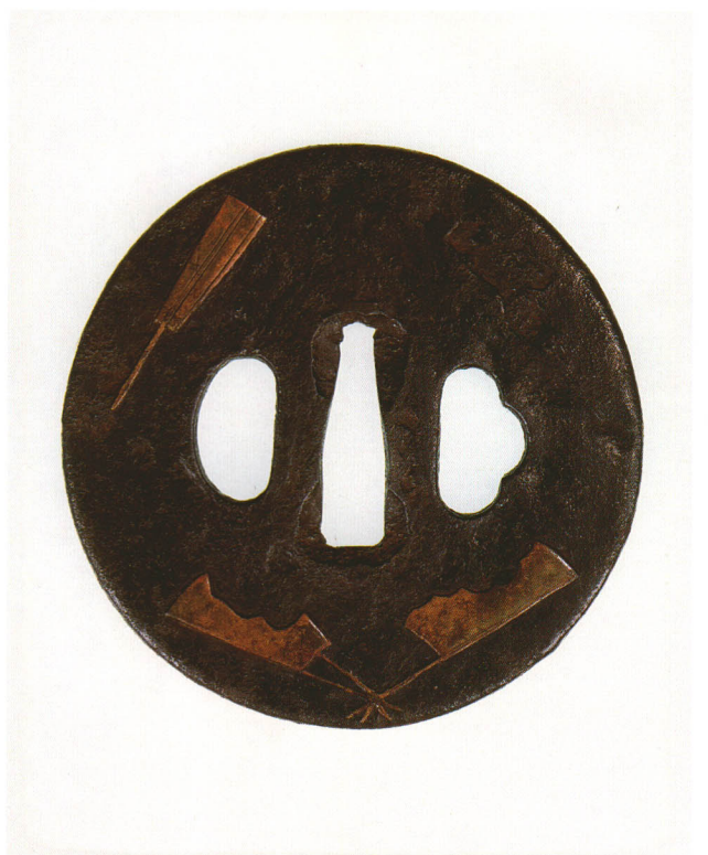
263 破扇図鐺 無銘 丸形・角耳小肉・鉄地・扇真鍮象嵌 厚さ4.5×縦76.0×横75.6mm