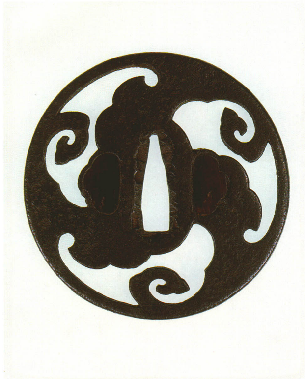
282 雲出透鐔 無銘 丸形・角耳小肉・鉄地 厚さ4.1×縦80.8×横80.5mm