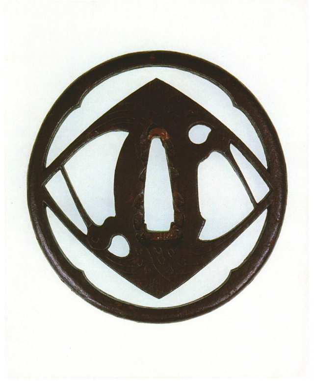
281 菱に鶴透鐔 無銘 土佐 丸形・丸耳・鉄地・毛彫 厚さ6.4×縦74.3×横71.0mm