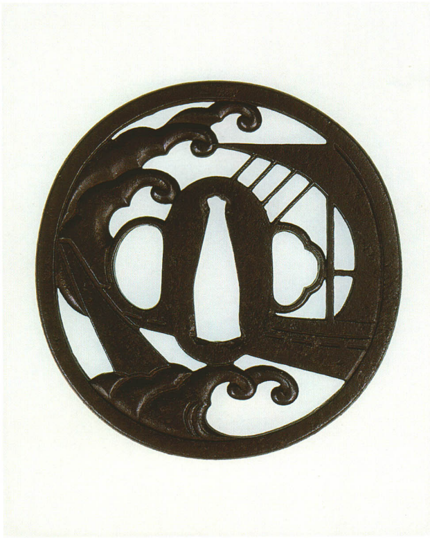
280 立浪・帆船透鐔 銘 助宗 丸形・角耳小肉・鉄地 江戸時代 厚さ4.2×縦79.0×横76.0mm