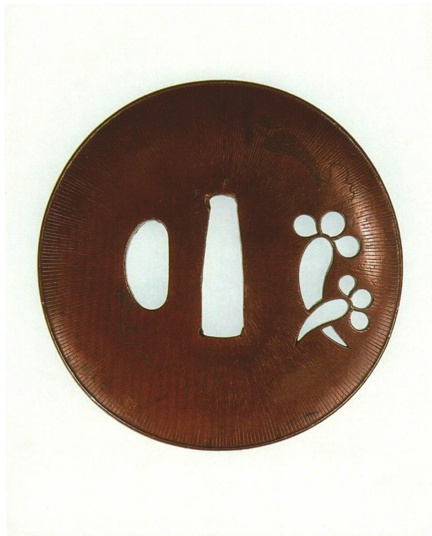
290 丁字透鐺 無銘 碁石形・共覆輪耳・素銅地・阿弥陀鐺 厚さ4.4×縦71.4×横70.5mm