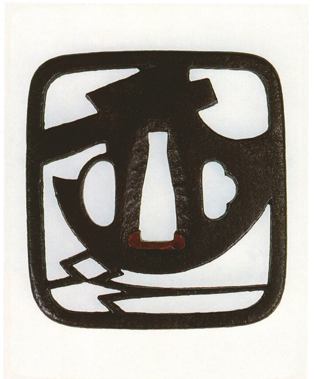
295 斧透鐺 無銘 隅切角形・角耳小肉・鉄地・生透し 厚さ6.2×縦73.2×横67.3mm