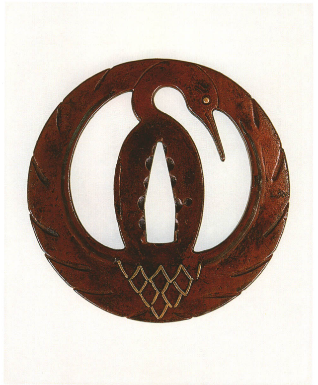
293 鶴丸紋透鐺 無銘 丸形・角耳小肉・素銅地・眼・腰羽根金平象嵌 厚さ4.1×縦79.0×横78.6mm