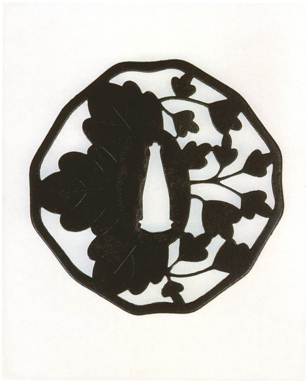
292 桐大判透鐺 無銘 十二角形・角耳・鉄地 厚さ3.0×縦87.0×横87.0mm