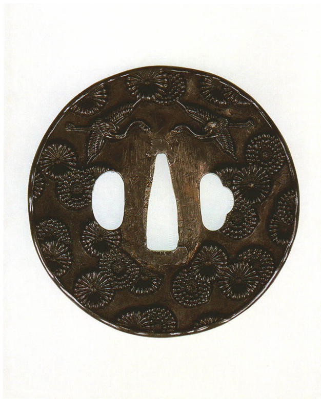
306 菊花・双鶴図鐺 無銘 鏡師 丸形・丸耳・鉄地・裏蝶平象嵌 室町時代 厚さ3.3×縦79.0×横79.0mm