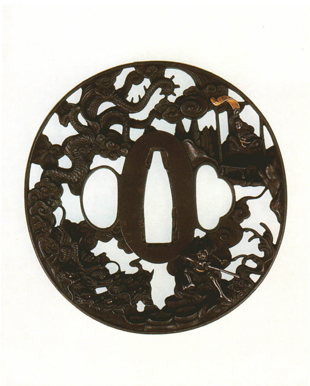
308 大和武尊・草薙剣生透鐺 無銘 鉄元堂 丸形・角耳・鉄地・金銀象嵌 桃山時代 厚さ4.0×縦84.0×横80.4mm