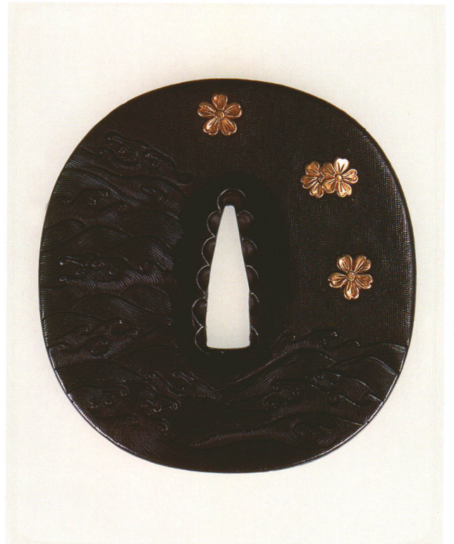
333 浪に桜図鐺 無銘 長丸形・角耳小肉・赤銅魚子地・桜金象嵌 江戸時代初期 厚さ5.3×縦83.0×横79.5mm