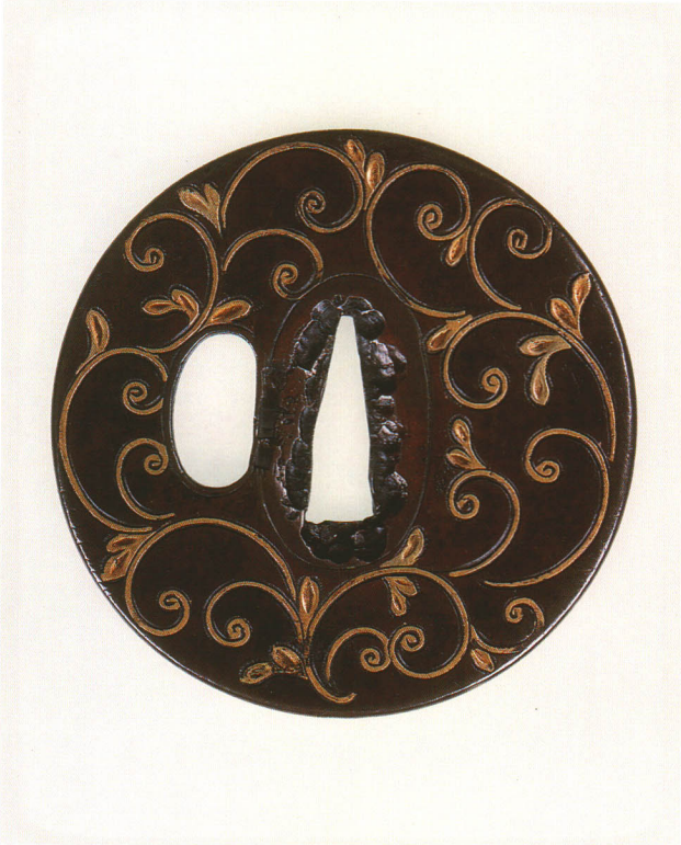
332 唐草図鐺 無銘 丸形・丸耳・素銅地・唐草金平象嵌 桃山時代 厚さ2.6×縦75.0×横74.4mm