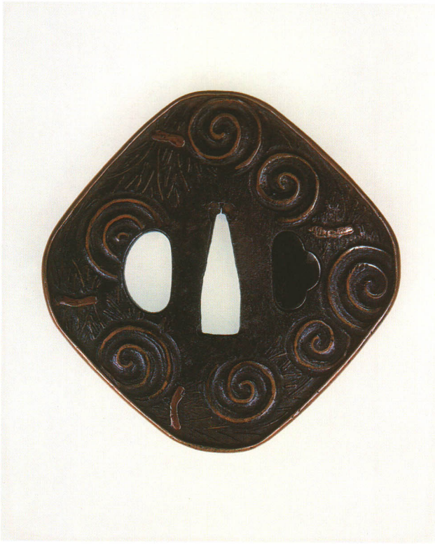
330 渦巻に柴図鐺 無銘 撫菱形・真鍮覆輪・鉄地・渦巻に柴真鍮象嵌 室町時代 厚さ5.2×縦81.8×横81.2mm