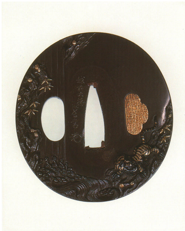
334 飛瀑猛虎図鐺 銘 越前大椽 長常(花押) 長丸形・角耳小肉・四分一地 江戸時代中期 厚さ4.4×縦65.0×横60.0mm