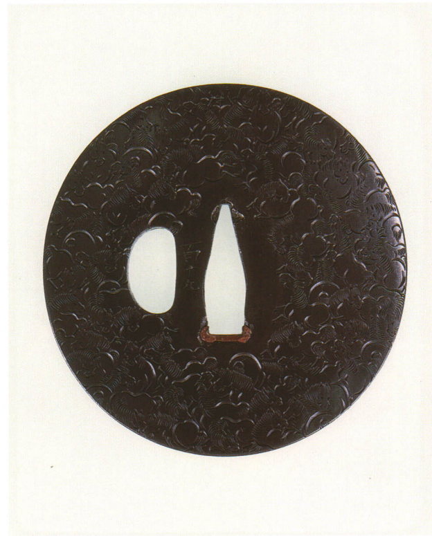
337 駒尽し図鐺 銘 乙柳軒 政随 丸形・丸耳・四分一地・毛彫 江戸時代中期 厚さ4.7×縦77.2×横75.3mm