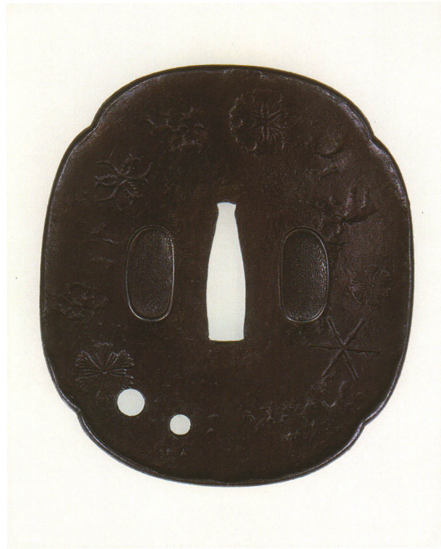
335 雪華文図打込鐺 無銘 一乗 長木瓜形・丸耳打返・鉄地 江戸時代後期 厚さ2.6×縦88.4×横78.4mm