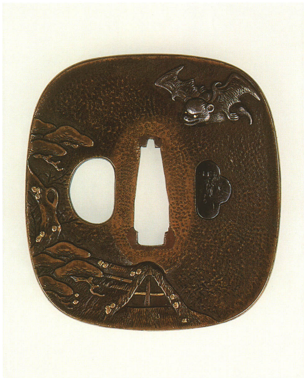
350 家松に蝙蝠図鐺 銘 常重 撫角形・角耳小肉・真鍮地 江戸時代後期 厚さ5.0×縦73.0×横67.4mm