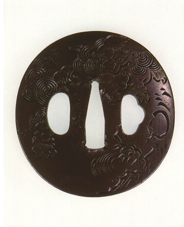
353 獅子牡丹図鐺 銘 宗興(花押) 長丸形・角耳小肉・四分一地 江戸時代後期 厚さ4.4×縦70.0×横67.0mm