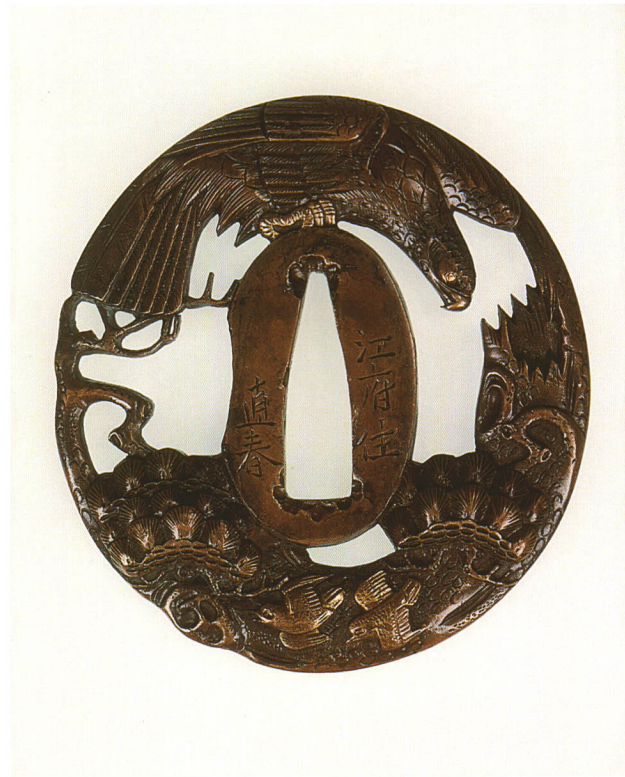
351 鷹と松図鐺 銘 江府住 直春 長丸形・丸耳・真鍮地 江戸時代後期 厚さ5.8×縦71.0×横66.0mm