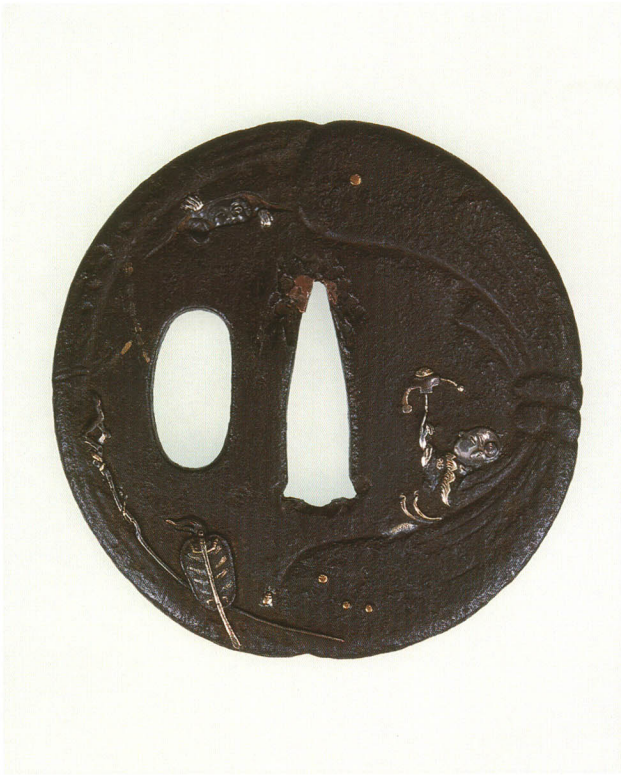
366 唐子図鐺 無銘 古奈良 丸形・丸耳・鉄地・銀象嵌 厚さ3.6×縦66.5×横66.0mm