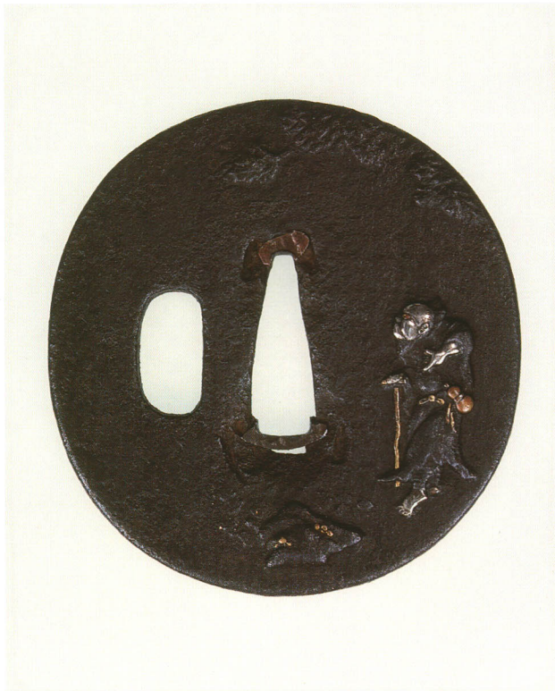
368 仙人図鐺 無銘 古奈良 丸形・角耳小肉・鉄地・金銀高彫象嵌 厚さ3.3×縦71.7×横68.3mm