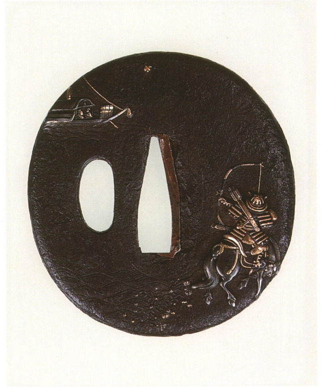
369 那須与市図鐺 無銘 古奈良 長丸形・丸耳・鉄地・金銀四分一象嵌 厚さ4.3×縦67.6×横63.4mm