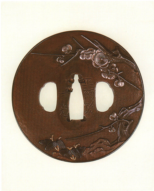
397 梅樹に笹図鐺・縁頭揃 銘 正阿弥 一光 丸形・赤銅覆輪・素銅地・肉彫赤銅銀色絵 江戸時代後期 厚さ4.2×縦77.0×横77.0mm