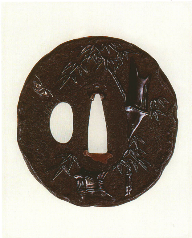
399 老竹・蝶図鐺 銘 信忠 丸形・打返し耳・鉄地・植目仕立・老竹赤銅 江戸時代後期 厚さ4.0×縦73.6×横69.4mm