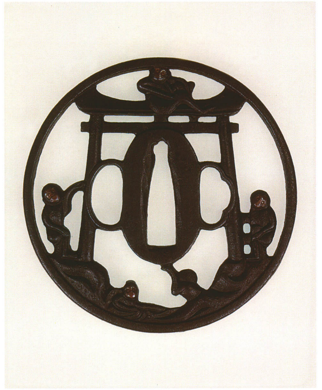
406 山王社透鐺 無銘 清成作 丸形・角耳小肉・鉄地 江戸時代中期 厚さ4.9×縦81.5×横81.0mm