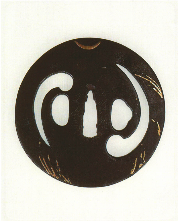
407 巴透鐺 銘 正阿弥 又次郎 丸形・角耳・鉄地・月金象嵌 江戸時代後期 厚さ5.4×縦91.0×横91.0mm