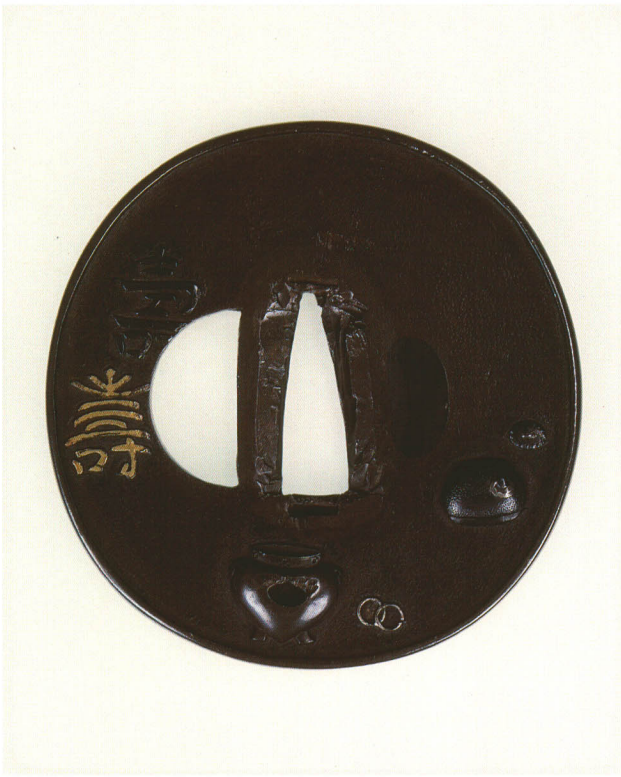
405 茶室据紋鐺 無銘 庄内正阿弥 丸形・鋤残し耳・四分一地 江戸時代中期 厚さ3.7×縦80.0×横79.0mm