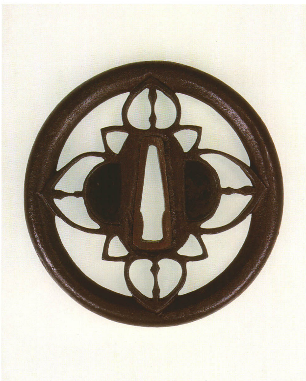
411 桃透鐺 無銘 庄内住吉友 丸形・丸耳・鉄地 江戸時代後期 厚さ6.7×縦80.4×横78.0mm