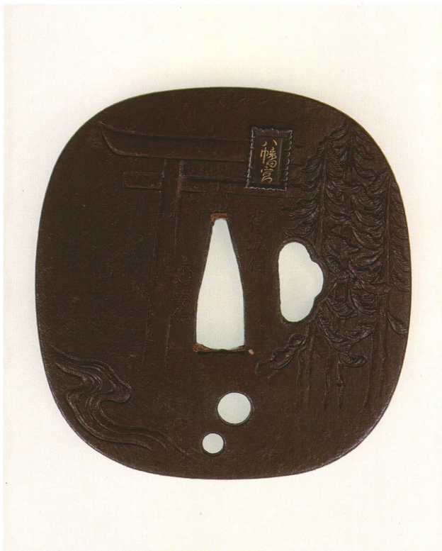
409 社頭図鐺 銘 雀城住 木村安倫 撫角形・角耳小肉・鉄地・八幡宮片切彫 江戸時代後期 厚さ5.3×縦84.6×横81.4mm