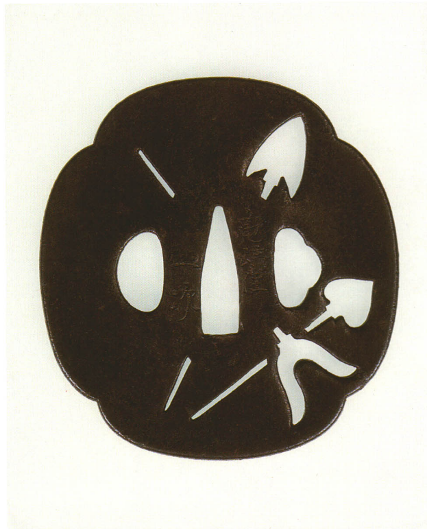
415 古代矢尻透鐺 銘 亀崎住 一次 長木瓜形・角耳・鉄地 江戸時代後期 厚さ4.0×縦88.6×横83.3mm