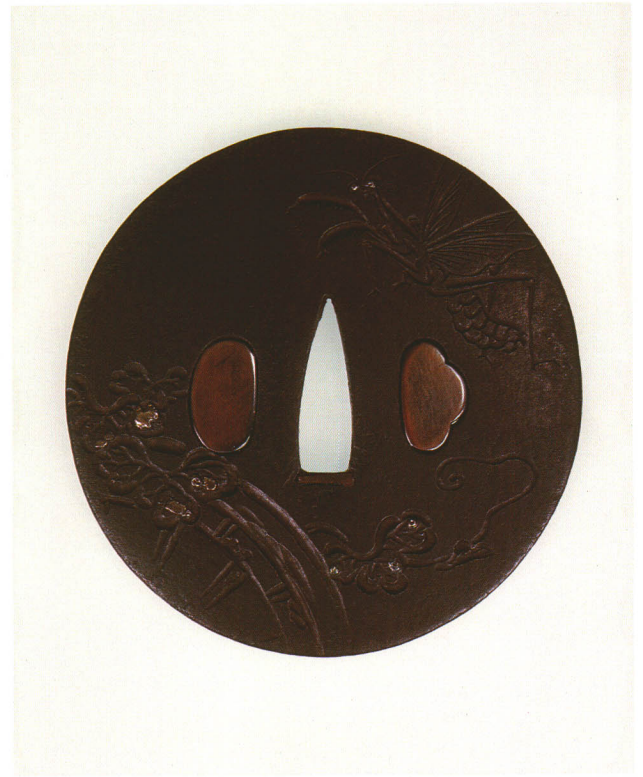
414 蟬螂に龍車図鐺 無銘 赤文 丸形・丸耳・鉄地・野茨の実金ウツトリ 江戸時代後期 厚さ4.8×縦84.5×横82.5mm