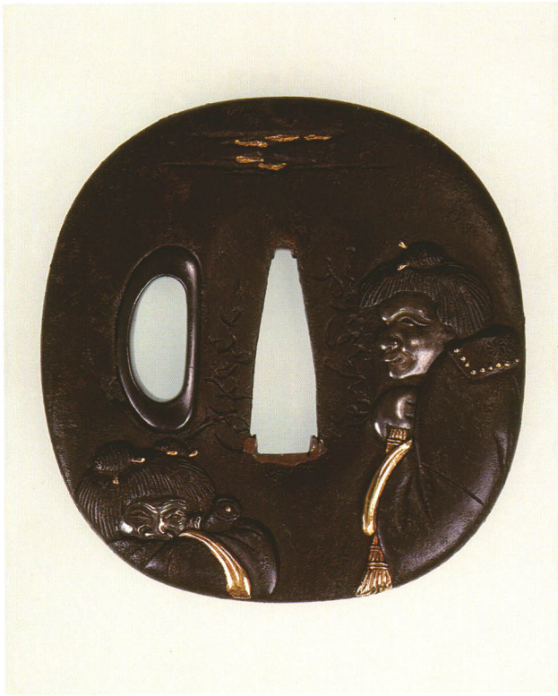
413 寒山拾得図鐺 銘 遊洛濟 赤文(花押) 長丸形・丸耳・鉄地・顔・手は四分一頭の飾金色絵 江戸時代後期 厚さ4.2×縦69.4×横66.6mm