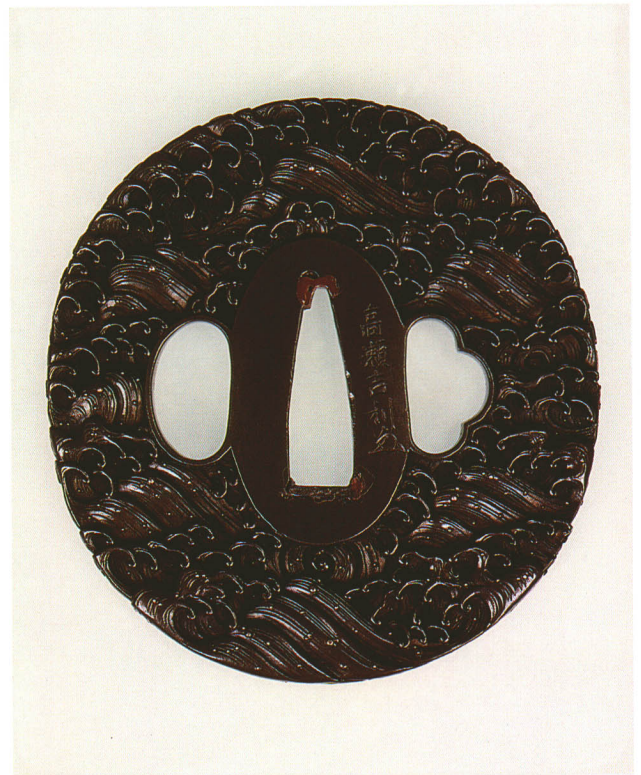
423 波浪図鐔 銘 高瀬吉利(花押) 長丸形・波形耳・四分一地 江戸時代後期 厚さ5.0×縦75.0×横71.0mm