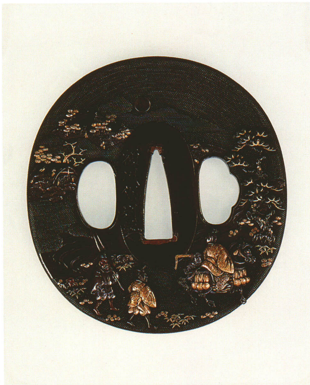
422 業平東下り図鐔 銘 額川保則(花押) 長丸形・丸耳・赤銅魚子地 江戸時代後期 厚さ4.6×縦74.0×横69.0mm