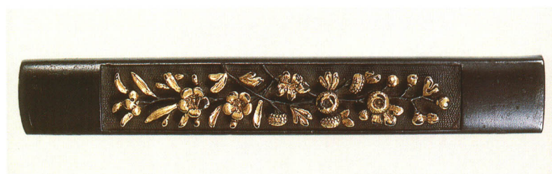
428 菊図小柄 無銘 古美濃 赤銅魚子地・菊金色絵 室町時代～桃山時代 厚さ5.0×縦96.0×横14.0mm