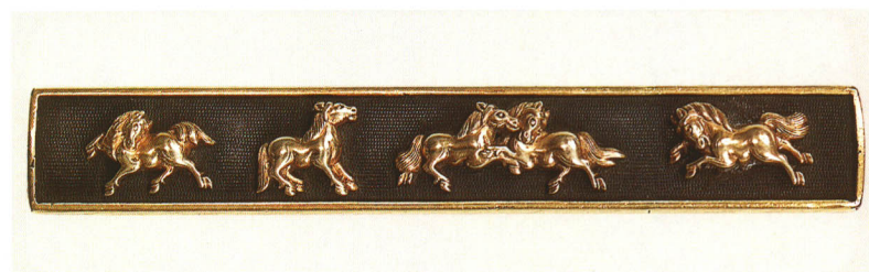
430 五頭馬図小柄 無銘 後藤徳乘 赤銅魚子地・純金・からくり 桃山時代 厚さ4.8×縦97.4×横15.0mm