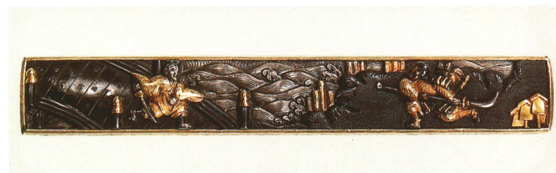
432 五條の橋図小柄 無銘 後藤程乘 赤銅魚子地・義經・弁慶金象嵌 江戸時代初期 厚さ5.2×縦97.0×横14.7mm