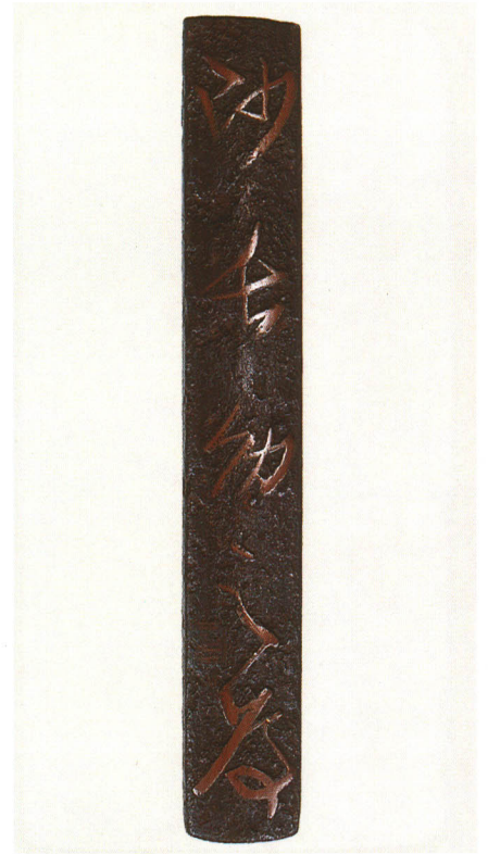
446 文字入小柄 無銘 鉄地・文字真鍮象嵌 厚さ5.5×縦97.0×横14.0mm