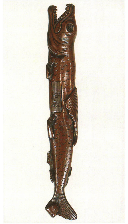
442 魚形小柄 銘 安親 素銅地 江戸時代中期 厚さ4.6×縦98.0×横14.0mm