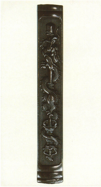
433 剣龍図小柄 銘 後藤光孝(花押) 赤銅魚子地 江戸時代後期 厚さ4.4×縦97.0×横14.4mm