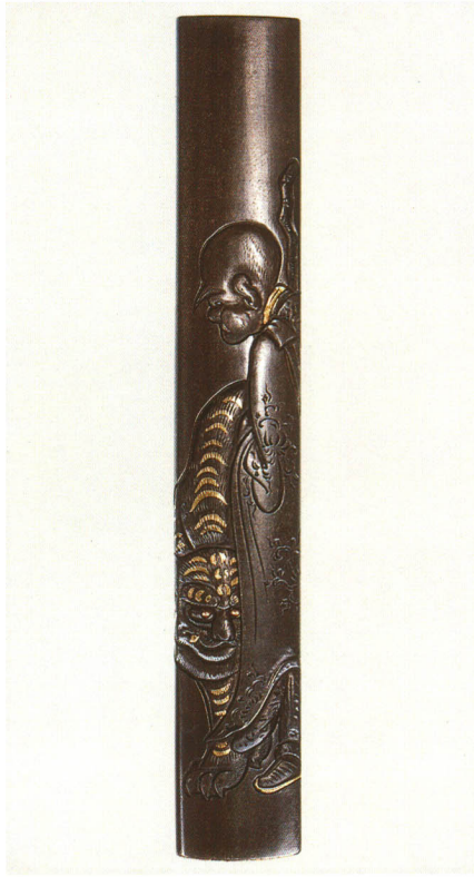
436 豊干禅子図小柄 銘 天明元年春日 長義作 四分一地 江戸時代後期 厚さ4.6×縦97.0×横14.6mm