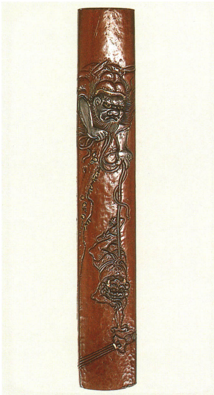
443 鍾馗と鬼図小柄 銘 乘意 素銅地 江戸時代後期 厚さ5.0×縦98.0×横15.0mm