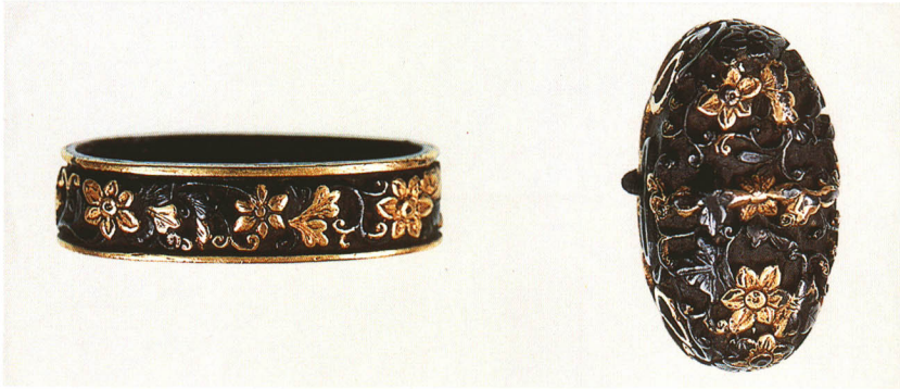
467 鉄線図縁頭 無銘 古美濃 赤銅地・金色絵 厚さ9.8×縦38.5×横22.0mm 厚さ12.0×縦34.0×横18.8mm