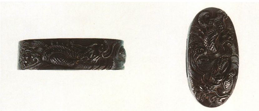
469 龍図縁頭 銘 後藤伝乗(花押) 赤銅地・龍高彫 江戸時代初期 厚さ10.5×縦38.0×横23.0mm 厚さ9.0×縦34.0×横17.8mm