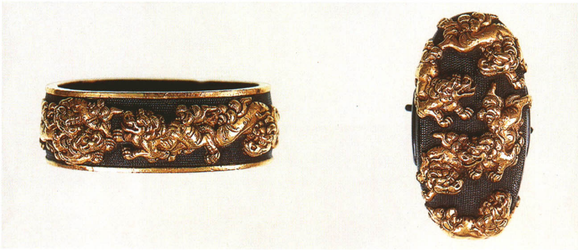
468 獅子図縁頭 銘 後藤伝乗(花押) 赤銅魚子地・金象嵌 江戸時代初期 厚さ14.0×縦41.2×横24.5mm 厚さ12.0×縦39.0×横21.0mm