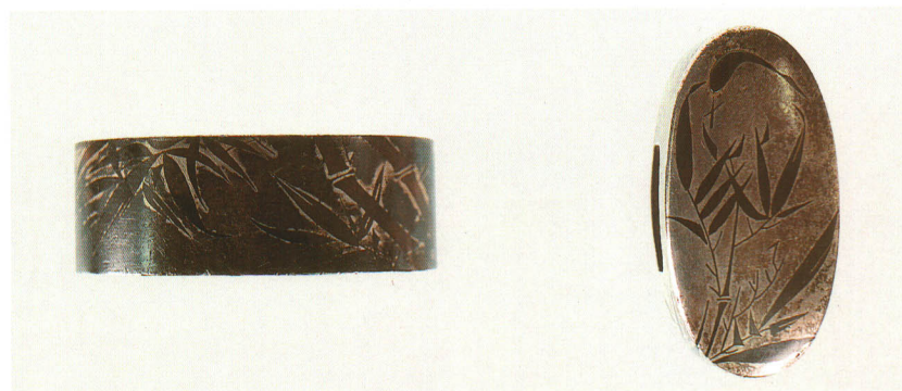
484 竹図縁頭 銘 杞柳軒 清隨(花押)

赤銅魚子地・馬金色絵 江戸時代後期 厚さ 15.0×縦 39.0×横 22.0mm 厚さ 10.0×縦 34.0×横 20.0mm