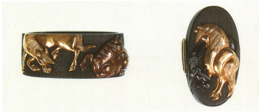
483 馬図縁頭 銘 英武(花押)

赤銅地 江戸時代後期 厚さ 11.0×縦 38.6×横 23.0mm 厚さ 8.4×縦 32.0×横 18.0mm