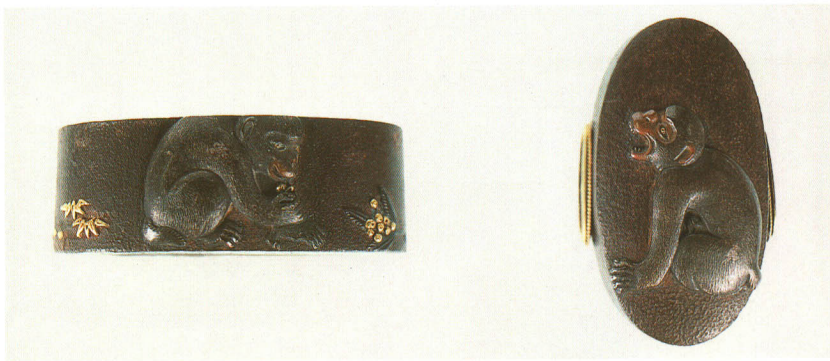
481 猿図縁頭 銘 岩本昆寿(花押)

鉄地 江戸時代中期 厚さ 13.2×縦 37.3×横 22.5mm 厚さ 9.5×縦 33.0×横 19.0mm