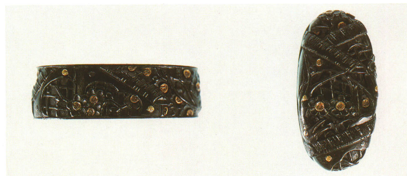
485 家に梅図縁頭 銘 美の住 正勝

銀地・竹墨平象嵌 江戸時代後期 厚さ 13.8×縦 38.0×横 22.0mm 厚さ 8.0×縦 35.0×横 18.0mm