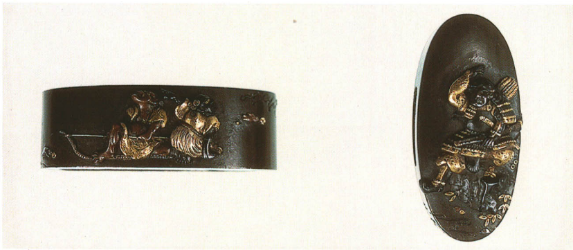
487 鎮西八郎為朝図縁頭 銘 美章 四分一地・金銀象嵌 江戸時代後期 厚さ12.5×縦38.0×横22.5mm 厚さ9.0×縦34.0×横16.0mm