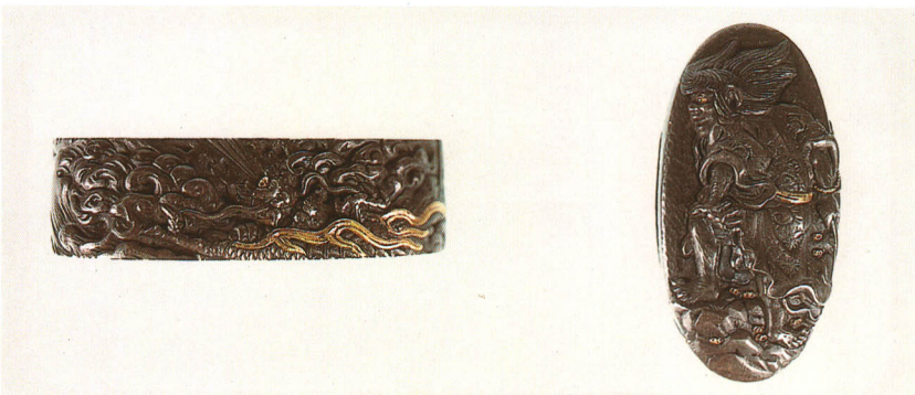
489 斬龍図縁頭 銘 熊谷義之(花押) 四分一地 江戸時代後期 厚さ11.0×縦38.0×横21.0mm 厚さ8.8×縦33.2×横17.0mm