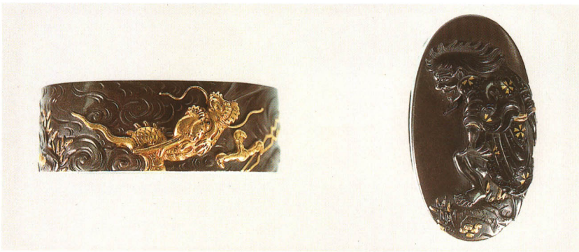
488 斬龍図縁頭 銘 小泉友寿(花押) 四分一地・斬龍金象嵌 江戸時代後期 厚さ13.0×縦38.0×横23.0mm 厚さ9.0×縦33.0×横18.5mm