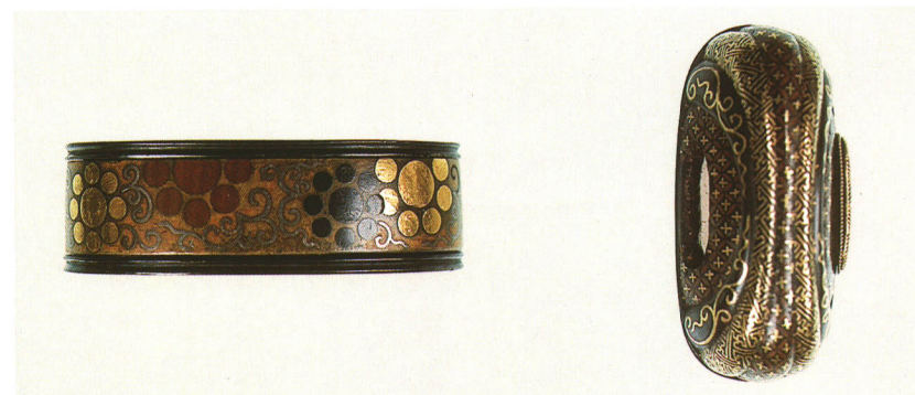
495 七宝九曜図縁頭 無銘 素銅地 厚さ11.5×縦37.0×横22.5mm 厚さ9.8×縦32.0×横15.6mm