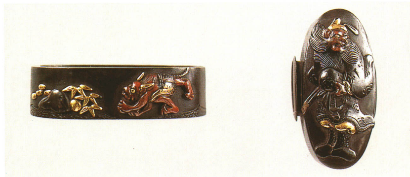
493 鍾馗・鬼図縁頭 無銘 四分一地・鍾馗鬼象嵌 厚さ10.0×縦37.0×横20.0mm 厚さ9.0×縦33.0×横16.2mm