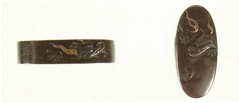
492 龍図縁頭 銘 水陽東寿作 四分一地・龍高彫色絵 江戸時代後期 厚さ8.6×縦37.4×横20.0mm 厚さ6.5×縦33.5×横15.5mm