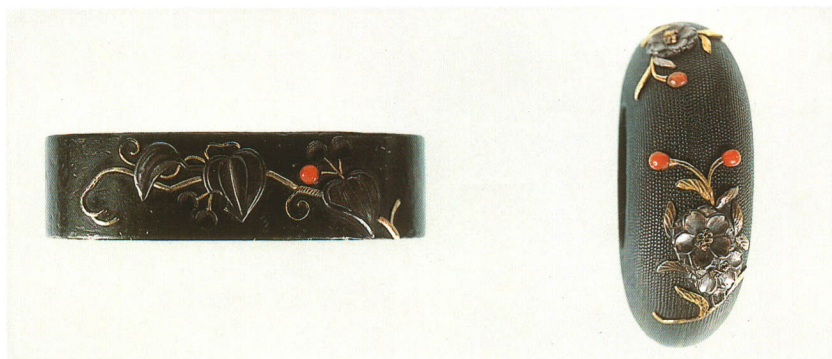
511 桜図縁頭 無銘

赤銅地・頭魚子地・桜象嵌サンゴ入 厚さ10.0×縦38.0×横22.0mm 厚さ12.0×縦34.0×横13.5mm