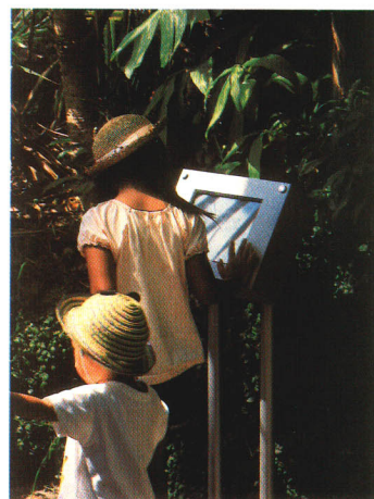
▲タッチングパネルモニター

アクアマリンふくしまの2階情報コーナーには、3台のパソコンが設置してあります。この端末では、各コーナーの静止画情報を全て閲覧できるほか、動画映像もご覧いただけます。また、館のホームページの閲覧もできるようになっています。