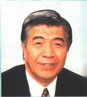
財団法人ふくしま海洋学習館 理事長 佐藤 栄佐久

2000年夏、いわき市小名浜に「ふくしま海洋科学館」アクアマリンふくしまがオープンします。