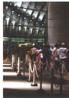
▲お客様の行列 Attendance in the evening

やサバ、そしてイワシの群は、蒼い宇宙に星が舞っているようでした……。 テラスの水柱花は、ビアガーデンに文字どおり花を添えました。