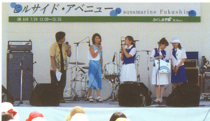
▲公開録音風景 Public recording of FM radio