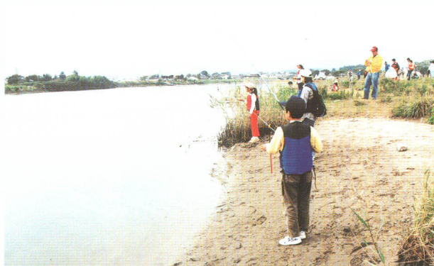
▲「親子で釣り体験」開催 Fishing school held at Samegawa River.

今回、アキラマリンふくしま初の試みとして、九月三十日と十月十四日にフィッシングスクール「親子で釣り体験」を鮫川河口で開催しました。