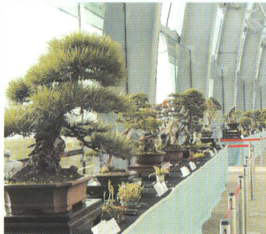
▲秋の日差をあびる盆栽 BONSAI exhibition in autumn

十月三十一日から十一月五日、当館エントランスホールで「海の男たちの盆栽」展を開催しました。この盆栽展は今年で二回目になり、小名浜盆栽研究会の皆様が丹精こめた盆栽を中心に、約四十点の作品を展示しました。会場では、秋の日差しの中で、ガラス越しに見える小名浜の海を背景に、黒松や杜松(としよう)、榎柏(しんぱく)などの迫力に満ちた古木の姿に、多くの方が足を止めていました。また、今年は葉の色づいたブナや、見事な実をつけた山柿など、季節感にあふれた作品も多く出品され、訪れた皆様に、ささやかな秋を感じていただけましたことと思います。