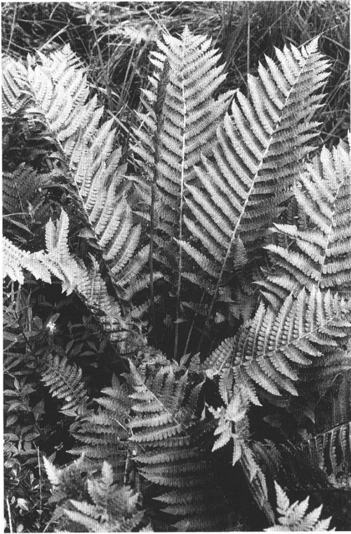
ヤマドリゼンマイ (雄国沼)