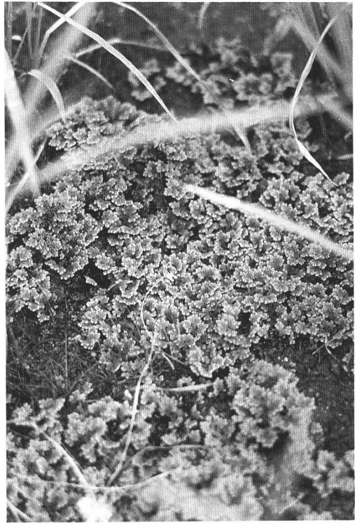
オオアカウキクサ (河沼郡会津坂下町)