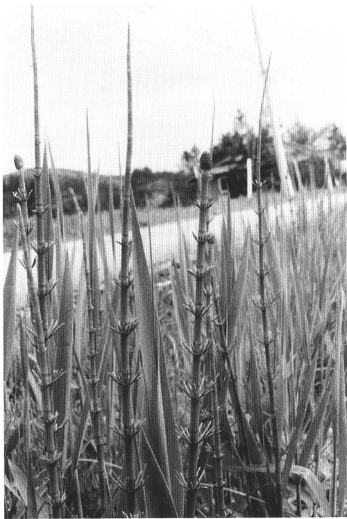
ミズドクサ (いわき市)