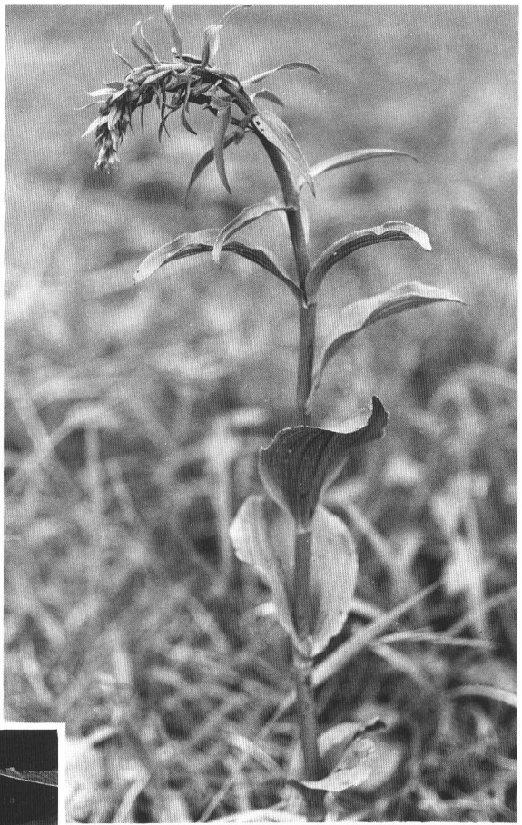
ハマカキラン (いわき市)