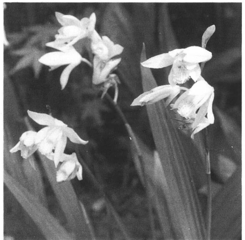
シロバナシラン (いわき市)