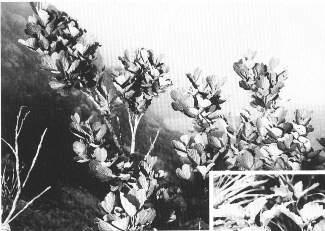
ヤハズハンノキ (飯豊山)