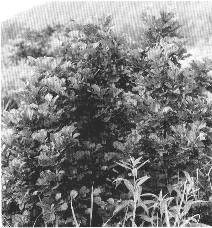
ミヤマカワラハンノキ (大沼郡金山町)