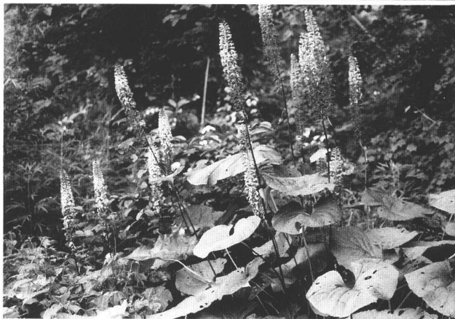
オタカラコウ (飯豊山)