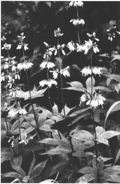
タカネツリガネニンジン (飯豊山)