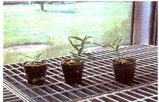
鉢に移植して育成