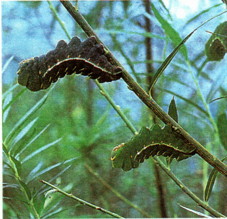
エゾノキヌヤナギで飼育中の天蚕幼虫

野生に生息する天蚕（ヤママユ）（※）を飼育する時、現在はクヌギやコナラを利用していますが、発芽・生育が早いエゾノキヌヤナギを使うことで大量に飼育する技術を開発しました。この技術を活用することによって、高品質な天蚕繭を安定的に生産することができます。