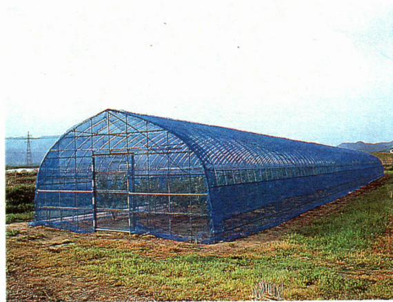
パイプハウスに網をかけて飼育します