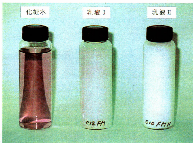
天蚕絹フィブロイン配合の化粧水と乳液 (乳液IIにはフィブロイン粉末配合)

天蚕繭の絹フィブロイン(※1)を溶解し、膜を調製する方法を開発しました。そのフィブロインを配合した化粧水は、紫外線の吸収や保湿性に優れるという特徴があります。