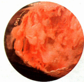
カメムシから分離された糸状菌