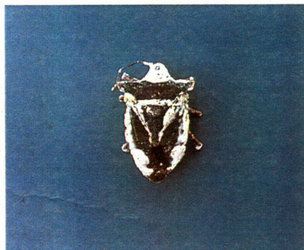
糸状菌に侵され死亡したカメムシ

カイコ病原微生物の研究手法を応用した微生物による害虫防除技術の開発に取り組んでいます。