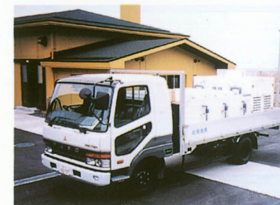
トラック（活魚槽積載）

ヒラメ稚魚の放流時の運搬に使用し、水温設定機能・汚濁物質の除去・DO設定機能を有した活魚槽を積載しています。