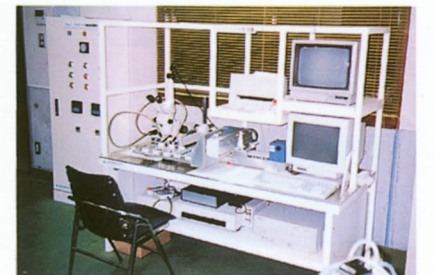
ワムシ自動計数装置