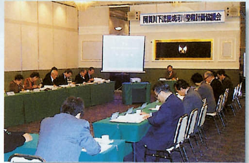
流域協議会開催状況