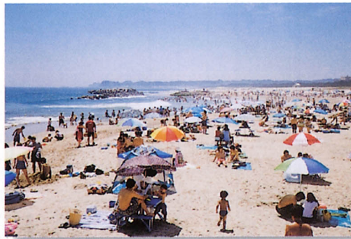
海岸利用(夏井海岸)