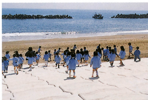
久ノ浜海岸(いわき市)