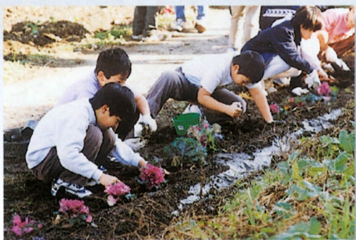
小学生による花植え