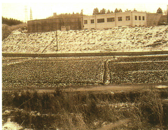
泉浄水場建設状況（昭和42年）