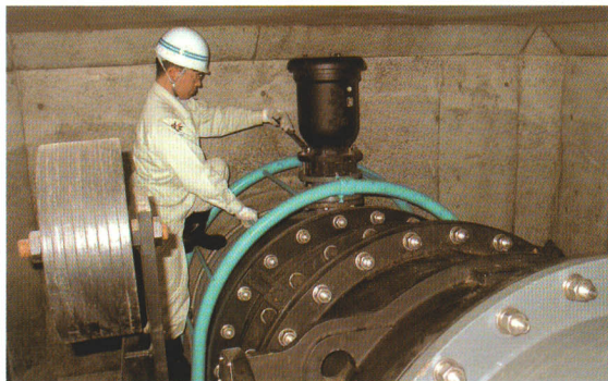
施設の点検(緊急遮断弁)