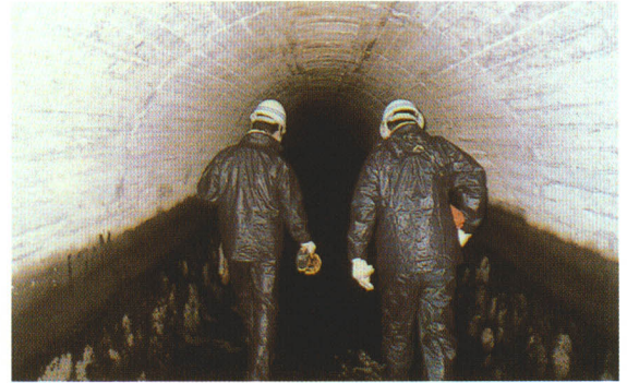
断水時の点検(隧道内漏水等調査)