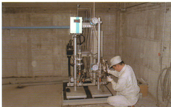
施設の点検(機械の正常作動の有無)