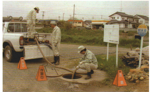
管路パトロール(マンホール内排水作業)