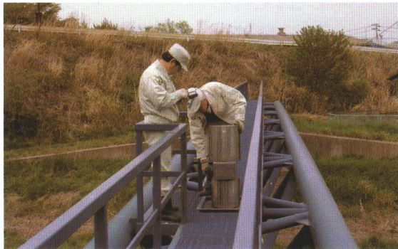
管路パトロール(配水設備の点検)