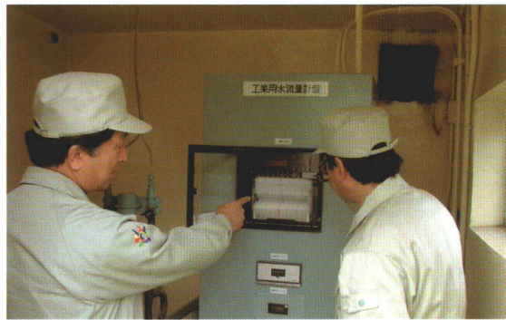
流量計(各ユーザー)の点検