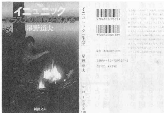
「イニニック〔生命〕」星野道夫著 新潮文庫